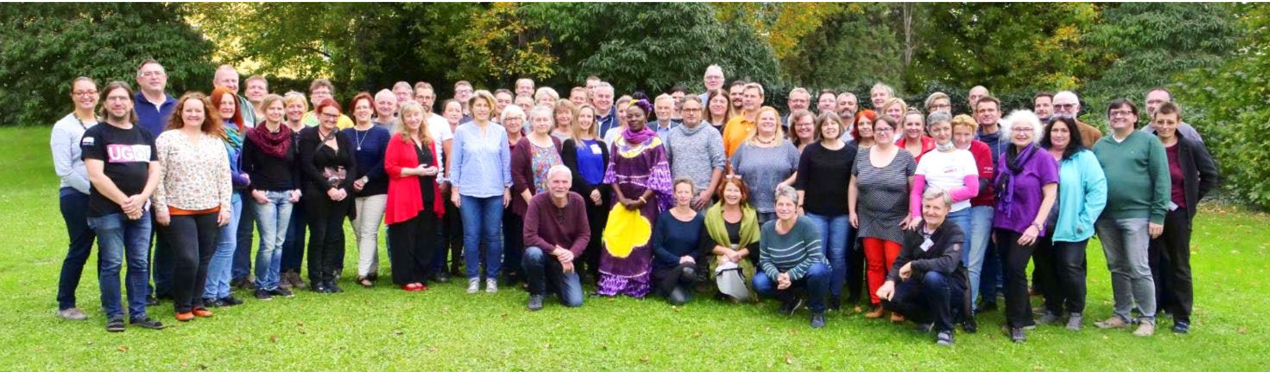
UG-Gruppenbild auf der Bundeskonferenz 2019 in Salzburg